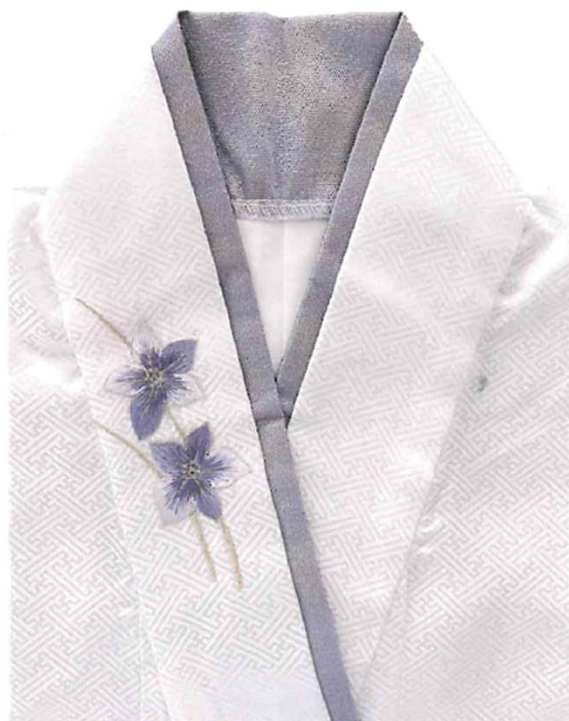
商品名：刺繡仏衣 紅牡丹 サイズ：丈150（二重襟）

気品ある白の生地に牡丹の刺繡を静かにあしらひ、「百花の王」と称される牡丹の意匠が旅立ちの装いに凜とした美しさと格調を添える仏衣。襟元の色彩がやさしいアクセントとなり、控えめながら印象に残る上品な仕上がりで、大切な方への想いを込めた人生最後の装いにふさわしい一着です。